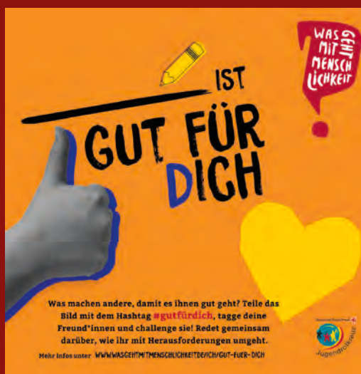
Die Vorlage der Kampagnenaktion #gutfürdich zum Teilen und Weiterverbreiten.