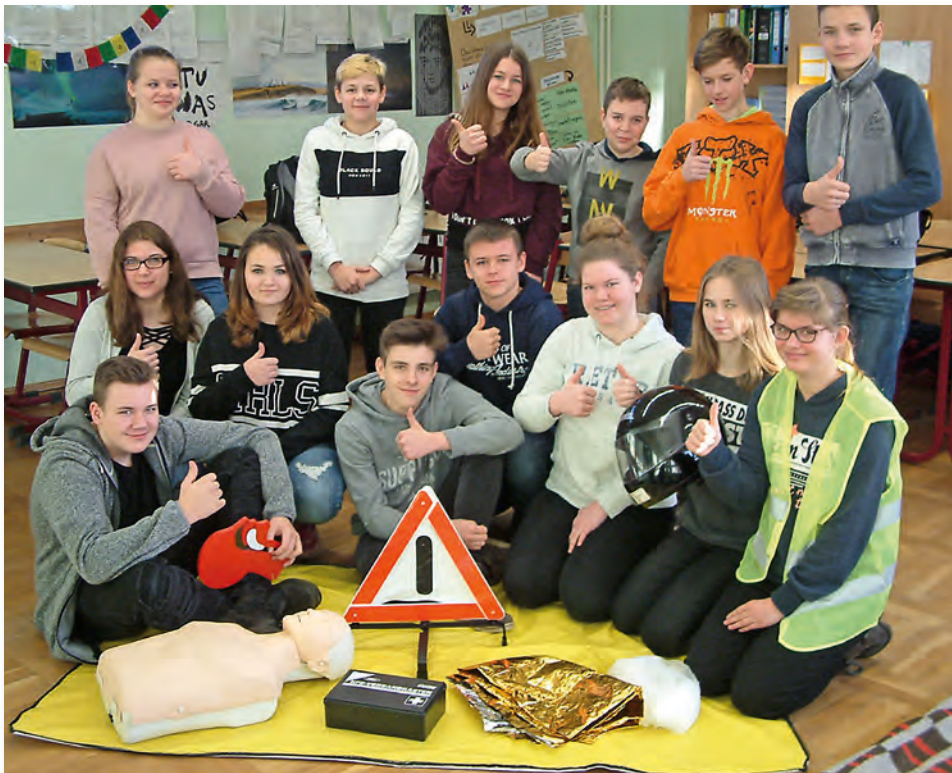
Toll: 14 Schüler der 8. Klasse haben an einem Samstag gelernt, wie man richtig Erste Hilfe leistet.