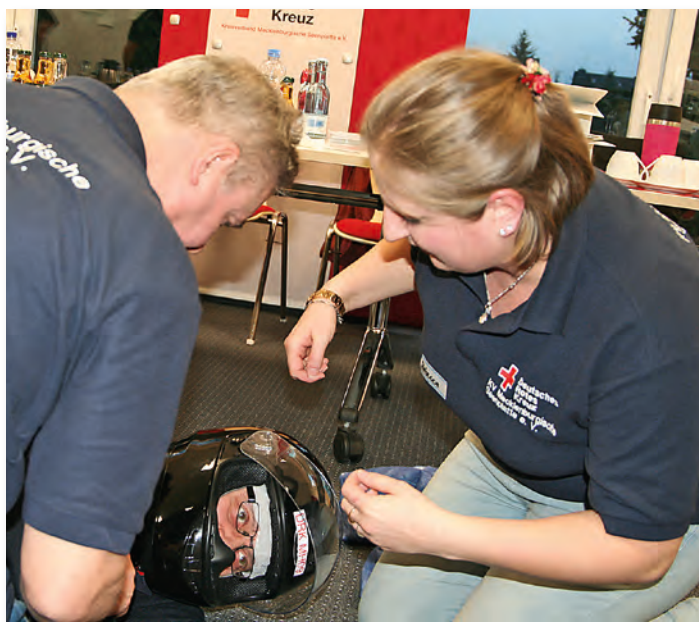
Auch die richtige Helmabnahme will geübt sein.

Die Unfallkasse und diverse Berufsgenossenschaften gehen ab 2018 hinsichtlich der Anmelde- und Kostenübernahmeregularien neue Wege und reagieren damit auf die geforderte schnellere Bearbeitung von Anträgen. Mithilfe des neuen Online-Verfahrens lässt sich schnell und unkompliziert überprüfen, ob für die vor-