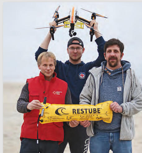
Die Rettungscopter-Piloten setzen auf Restube und erlernen in ihrer Ausbildung den Umgang damit.