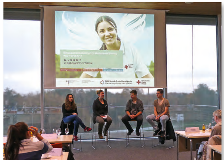
FSJ-Teilnehmer im Interview.