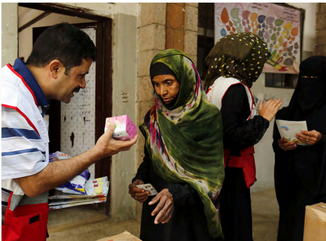
Cholera-Epidemie: Freiwillige Helfer sprechen mit Frauen über vorbeugende Maßnahmen und verteilen Seife sowie Informationsmaterial.

Das Rote Kreuz ist eine der wenigen Hilfsorganisationen, die im Jemen noch landesweit agieren. Gemeinsam mit dem Jemenitischen Roten Halbmond wird versucht, die Menschen in den besonders betroffenen Gebieten mit dem Notwendigsten zu versorgen und die Cholera einzudämmen. ■ C.M. / Quelle: DRK-Generalsekretariat