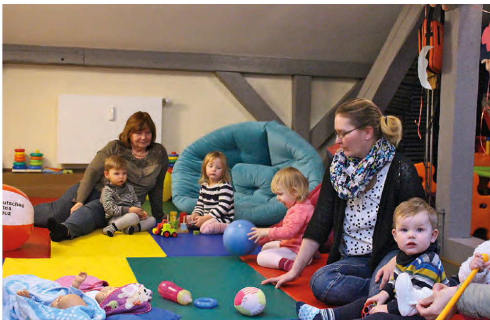
Die Eltern-Kind-Gruppe beim gemeinsamen Spielen.

Mit dem Umzug in den BürgerBahnhof haben sich die Arbeitsbedingungen wesentlich verbessert. Die neuen barrierefreien