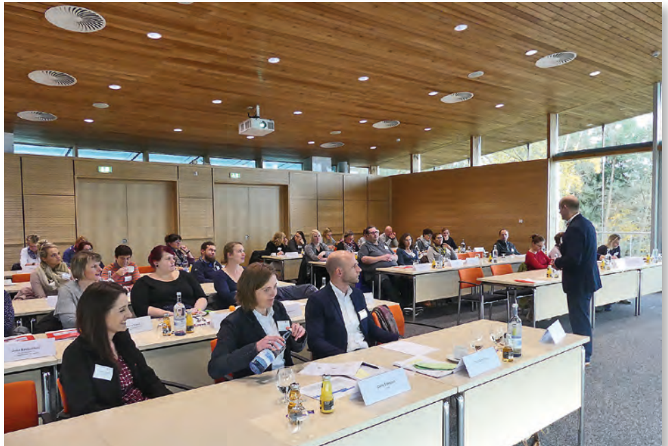
Konferenzteilnehmer im DRK-Bildungszentrum.

Zudem wurde das Thema der pädagogischen Anleitung weiter vertieft. Anregungen und Verbesserungsvorschläge sind dankend angenommen worden. Drei Workshops bildeten dafür den Rahmen: Personalentwicklung und Freiwilligendienst, Pädagogische Anleitung sowie Zusammenarbeit von Einsatzstellen und Trägern.